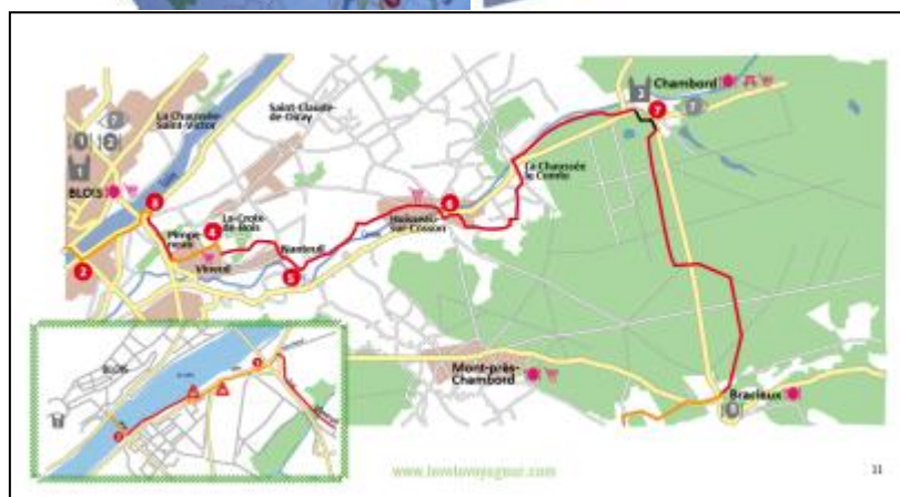
Exemple type de guide topographique

Vous recevez vos documents de voyage par voie postale à l'adresse indiquée. Lors d'une réservation à moins de 10 jours du départ, les documents seront directement envoyés au lieu de départ du circuit.